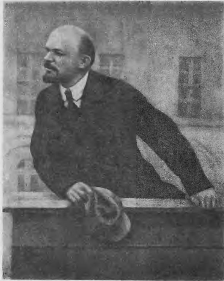
В. И. ЛЕНИН НА ТРИБУНЕ.

Теперь с Владимиром Ильичом работали три курсанта и двое рабочих.