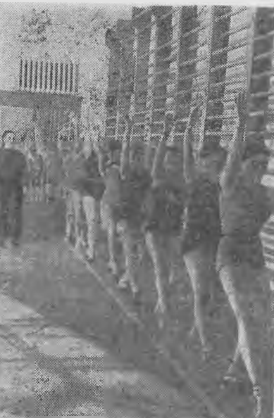
В спортивном павильоне университета.

циплины и невяки на игру заняла только пятое место, хотя сна вполне могла быть на третьем месте.