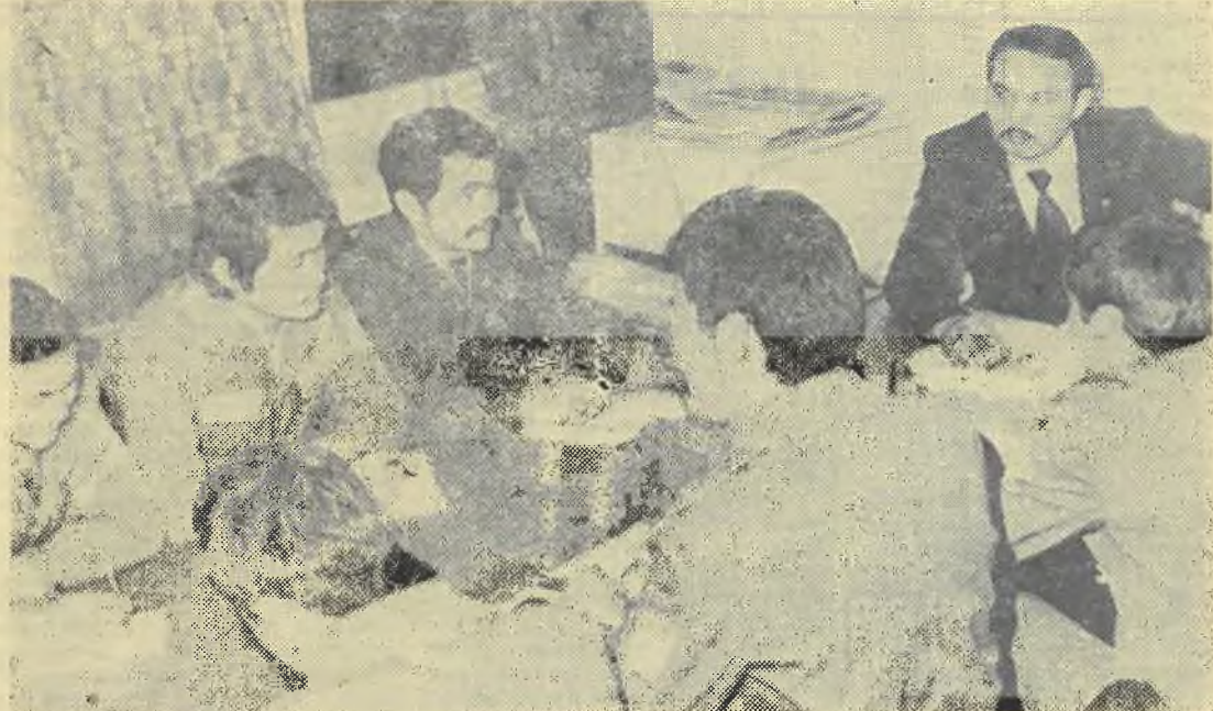
На снимке: Идет заседание Центрального штаба ССО КазГУ.

Пройдет два месяца и рядом с аулом появятся ряды типовых двухквартирных домов, несколько не нарушающих прежней гармонии долины. И эту первую, тогда еще единственную улицу, бойцы студенческого строительного отряда КазГУ назовут — Университетской. Так начинали строить два года назад совхоз «Кожсайский» в Нарынкольском районе.