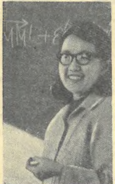
жұмыстармен айналысу саған ауырлау тиіп жүр-ау, шамасы.

— Қызым,-деді ол келіп жайғасқан Бәланың ұяң жүзіне барлай қарап, — Байқаймын ғылыми