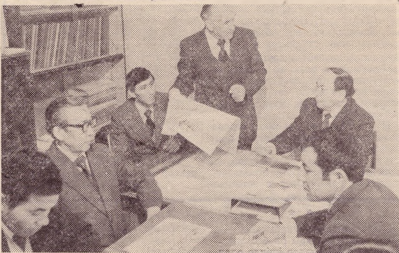
На снимке: Проект обсуждает коллектив преподавателей факультета журналистики.