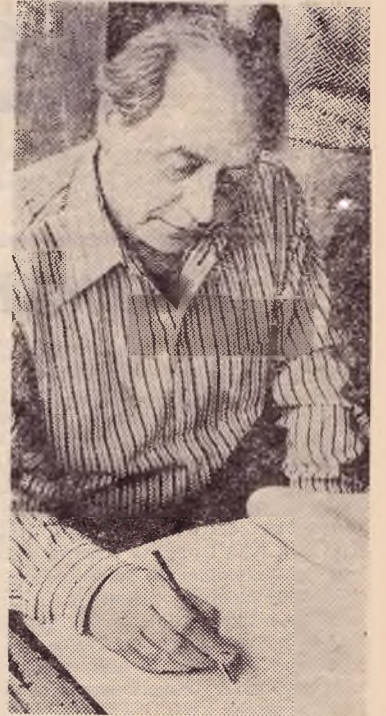
На снимке: автограф дает народный артист СССР И. А. Моисеев.