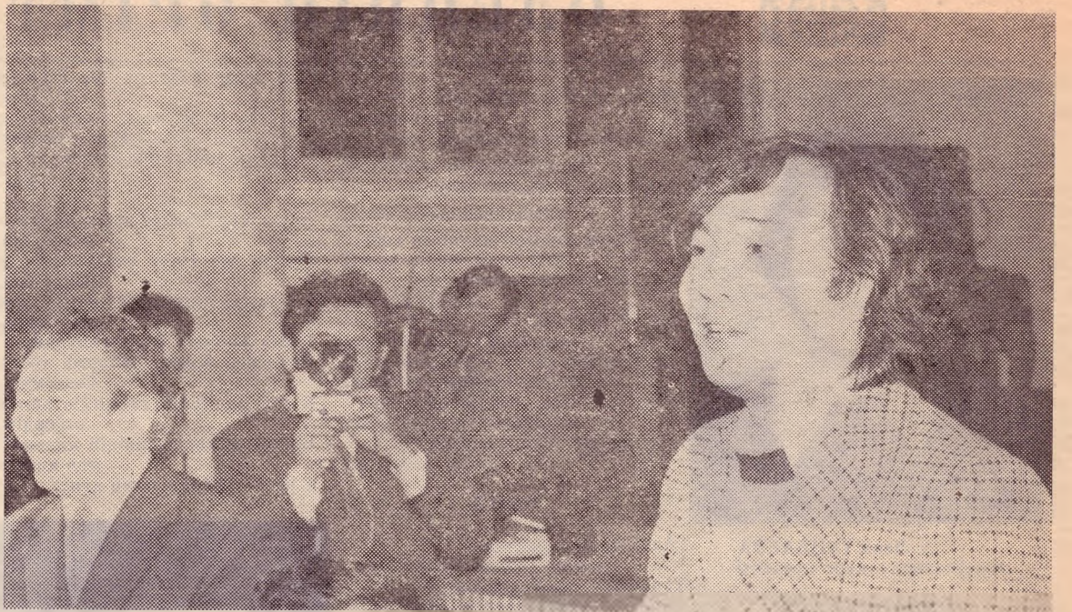
На снимке: поэт Олжас Сулейменов — гость «Семи муз».