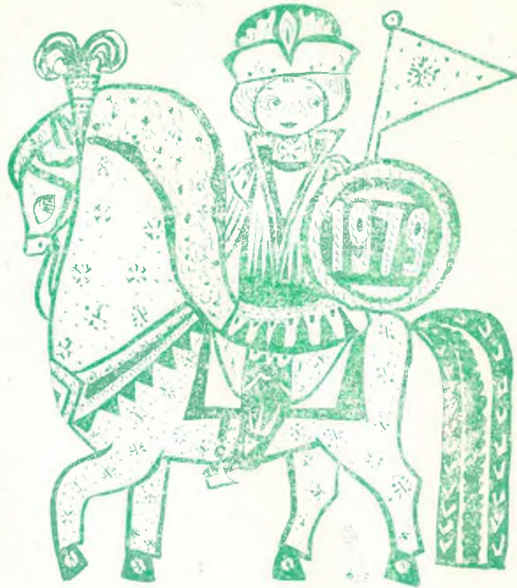
ЖЫРЛАЙЫҚ КӨНЕ, БҮЛ КҮНІ

Армысың, әсем жаңа жыл! Сағынышпен сені шын күтсем. Жазайын саған жаңа жыр Ақындық таза пәктікпен. Бар сенің әнің ақ қарда, Қаңтарда жауған алғашқы. Бар сенің әнің қырларда, Шырқаған жастар талмастан. Бар сенің әнің бақтарда Әсем үнмен айтылған. Бар сенің әнің сырларда Сол бір күні ой тұнған. Жаңа жыл деген көп бақыт, Көп бақыт, біткен-бітпеген.