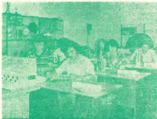
На этих снимках вы видите научно-исследовательские лаборатории кафедры прикладной математики.

В настоящее время в университете разрабатываются 390 научных тем, из которых 17 выполняются по народнохозяйственному плану и 18—по отдельным Постановлениям правительства, 80 тем координируются планами АН СССР и Казахской ССР. Общий объем выполняемых НИР в 1978 году составляет, 5,5 млн. рублей из которых более 4 млн. рублей по хоздоговорам с научно-исследовательскими институтами, предприятиями и организациями ряда Министерств СССР и союзных республик.