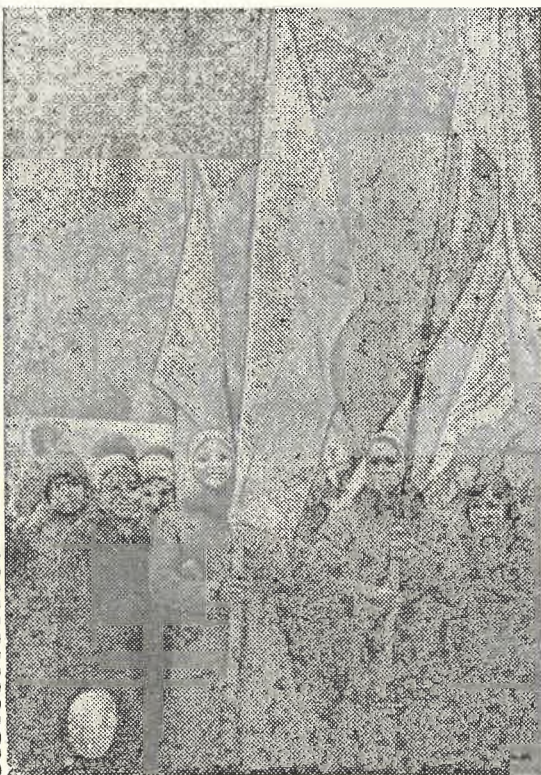
ФОТОРЕПОРТАЖ С ПРАЗДНИЧНОГО ПАРАДА, ПОСВЯЩЕННОГО 61 ГОДОВЩИНЕ ВЕЛИКОЙ ОКТЯБРЬСКОЙ СОЦИАЛИСТИЧЕСКОЙ РЕВОЛЮЦИИ.