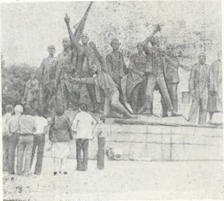
Мемориальный памятник жертвам фашизма в Бухенвальде.

Каждый вечер руководство лагеря готовило что-нибудь новое, начиная с дискотек, бесед с молодыми рабочими и форумов на актуальные темы, кончая спортивными праздниками и днями, где гости ГДР выступали со своей программой. Руководство лагеря прилагало все усилия, чтобы жизнь здесь была интересной и разнообразной. Все зарубежные студенты были очень благодарны лагерному руководству.