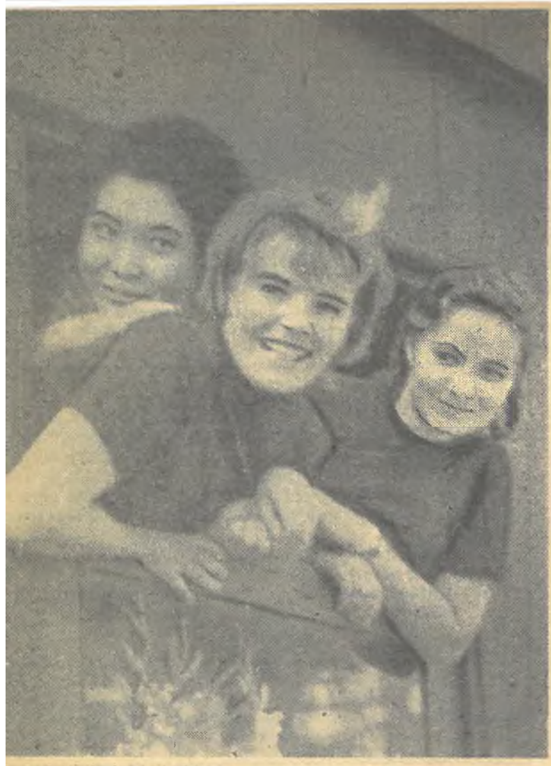
Кажется, недавно провожали этих девушек с Алма-Атинского вокзала сельские стройки в Актюбинскую область, а уже прошел месяц, как они дятся в хозяйствах Карабутацкого производственного управления.