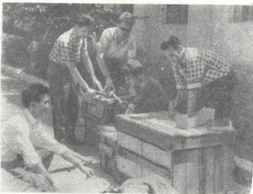
На снимке: группа студентов медицинского института упаковывает спорт-культуринвентарь и спецодежду перед отправкой к месту стройки.

При выполнении кровельных работ кровельщики должны быть снабжены предохранительными поясами и нескользящей обувью. Рабочие, выполняющие работы на кровлях с уклоном более 25°, должны быть снабжены, кроме предохранительных поясов, переносными стремянками шириной не менее 30 сантиметров с нашитыми на них планками.