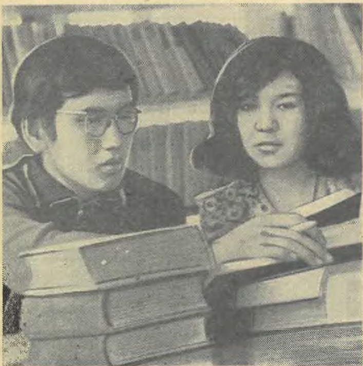
И снова сессия...