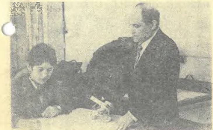
На снимке: прием зачета на геофаке.

формации), применению технических средств обучения. В наших социалистических обязательствах на 1977 год предусматривается также усилить научно-исследовательскую работу. Намечено, в частности, подготовить к публикации несколько статей о результатах исследования по метеорологии и климатологии Казахстана, имеющих практическое значение для развития народного хозяйства республики. По результатам этих исследований будут кроме того под-