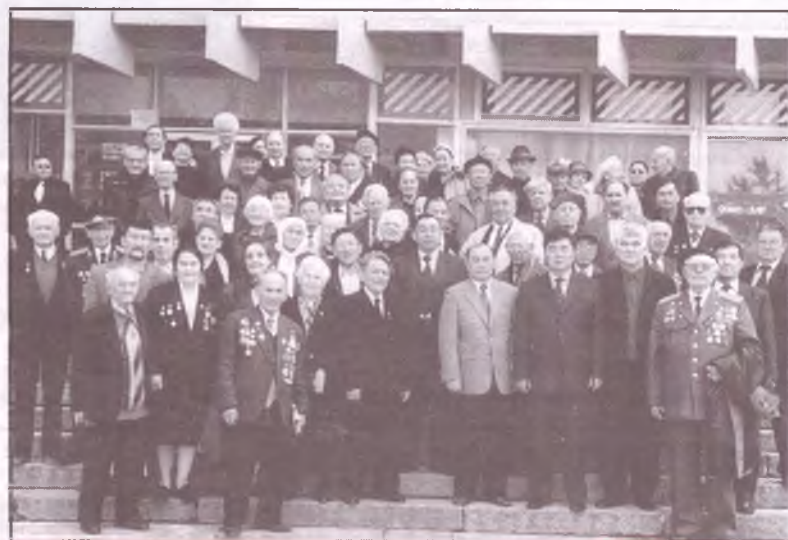
Встреча с ветеранами Великой Отечественной войны и трудового фронта - преподавателями и сотрудниками университета (2003г.)

тов пен З.Мұсырмановтар сөз сөйлеп, кейінгі ұрпақтардың соғыс атты тажалды көрмеуіне, ашық аспан астында бейбіт өмір кешулеріне тілектестік білдірді. Олардың тағылымы бар төлім