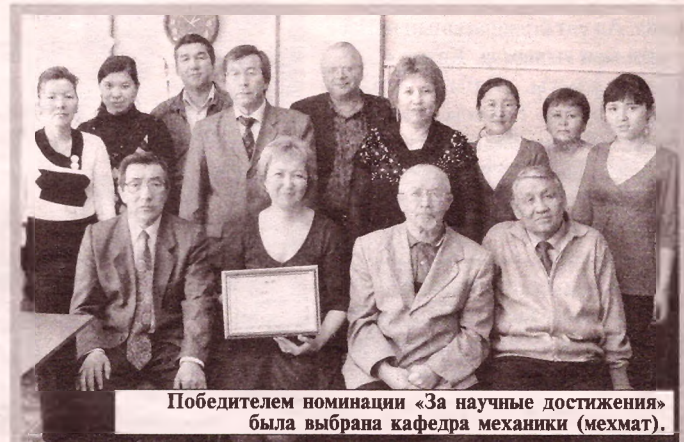
Победителем номинации «За научные достижения» была выбрана кафедра механики (мехмат).

24 марта в Научном совете были подведены итоги конкурса среди всех кафедр Казахского национального университета имени аль-Фараби. Конкурс дал возможность уделить заслуженное внимание всем педагогам, и их кропотливому труду в борьбе за знание. Конкурс проходил по разным номинациям, как за неисчерпаемый вклад в развития образования, за успешные открытия в научной сфере, за внедрение инновационных технологий в образовательный процесс, за вклад имиджа университета и многих других похвальных трудов и т.д. По окончании конкурса победителями вышеперечисленных номинации стали 13 кафедр.