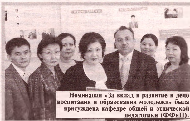
Номинация «За вклад в развитие в дело воспитания и образования молодежи» была присуждена кафедре общей и этнической педагогики (ФФИП).