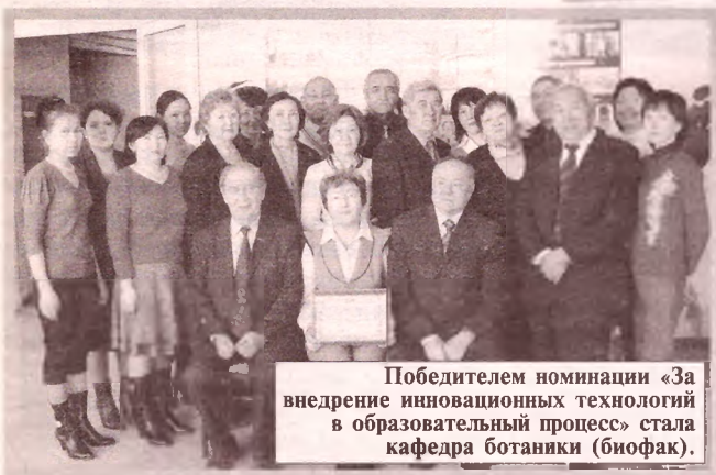
Победителем номинации «За внедрение инновационных технологий в образовательный процесс» стала кафедра ботаники (биофак).