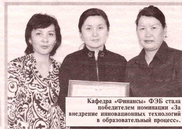
Кафедра «Финансы» ФЭБ стала победителем номинации «За внедрение инновационных технологий в образовательный процесс».