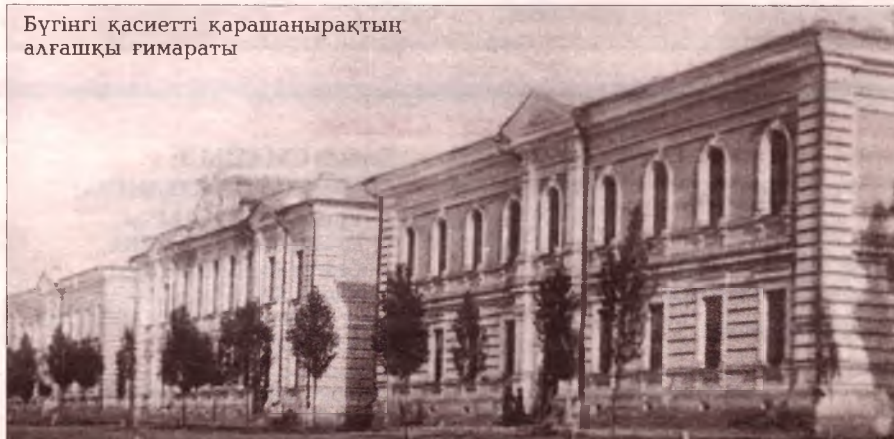
Бүгінгі қасиетті қарашаңырақтың алғашқы ғимараты