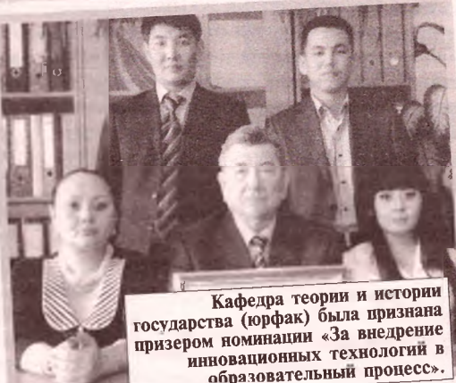
Кафедра теории и истории государства (юрфак) была признана призерами номинации «За внедрение инновационных технологий в образовательный процесс».