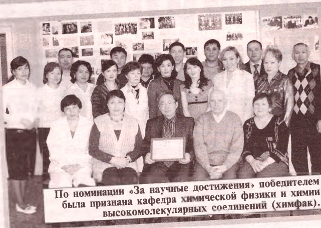
По номинации «За научные достижения» победителем была признана кафедра химической физики и химии высокомолекулярных соединений (химфак).