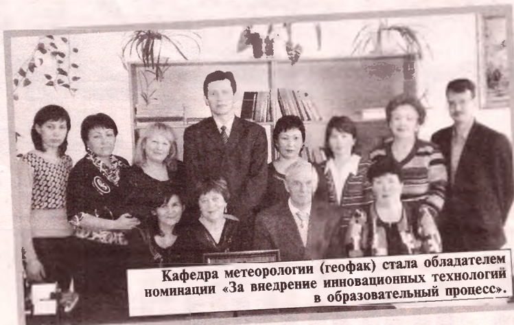
Кафедра метеорологии (геофак) стала обладателем номинации «За внедрение инновационных технологий в образовательный процесс».