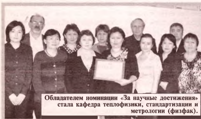
Обладателем номинации «За научные достижения» стала кафедра теплофизики, стандартизации и метрологии (физфак).