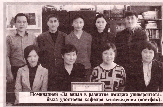
Номинацией «За вклад в развитие имиджа университета» была удостоена кафедра китаеведения (востфак).