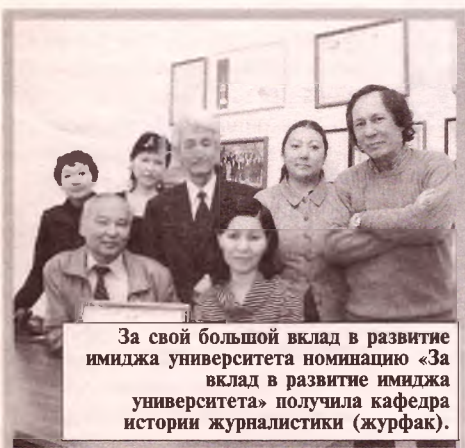
За свой большой вклад в развитие имиджа университета номинацию «За вклад в развитие имиджа университета» получила кафедра истории журналистики (журфак).