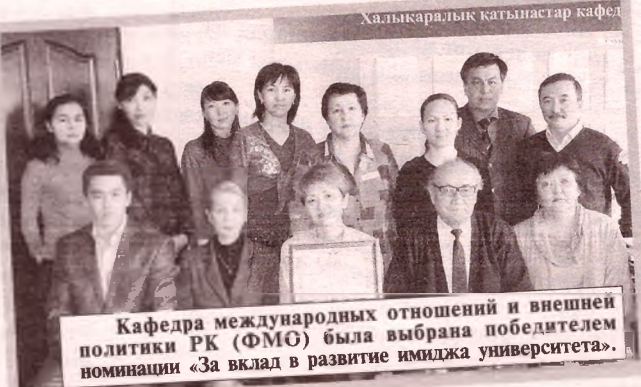
Кафедра международных отношений и внешней политики РК (ФМО) была выбрана победителем номинации «За вклад в развитие имиджа университета».