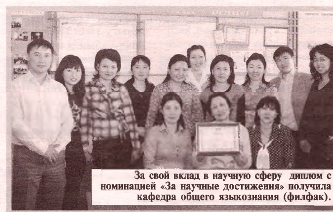
За свой вклад в научную сферу диплом с номинацией «За научные достижения» получила кафедра общего языкознания (филфак).