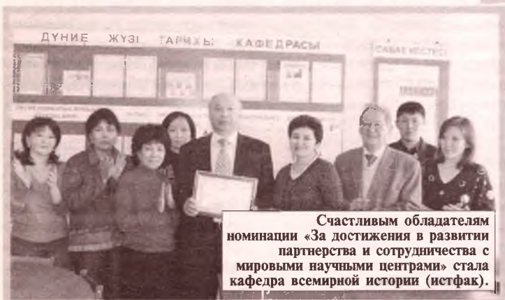
Счастливым обладателям номинации «За достижения в развитии партнерства и сотрудничества с мировыми научными центрами» стала кафедра всемирной истории (истфак).