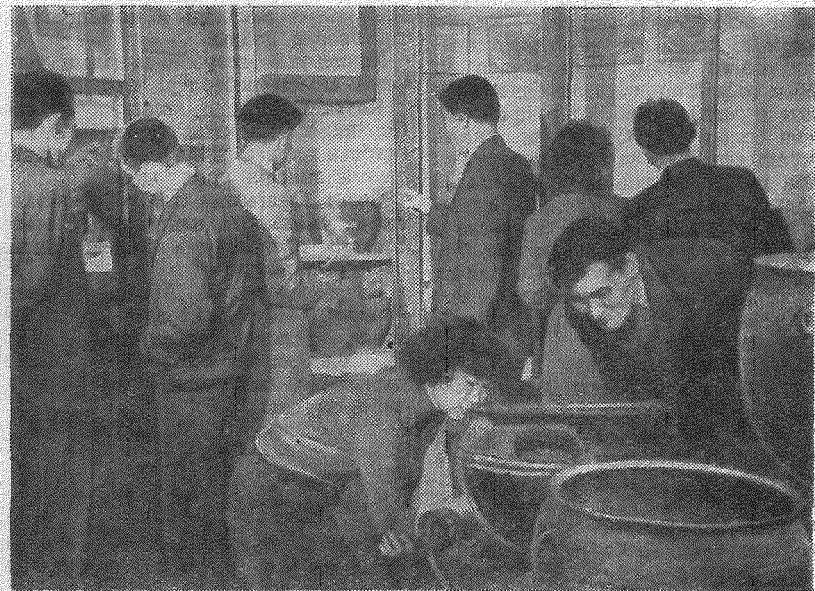
Тарих факультетінің студенттері республикалық музейге жиі барып, ондағы экспонаттармен танысады, республикамыздың тарихын зерттейді.