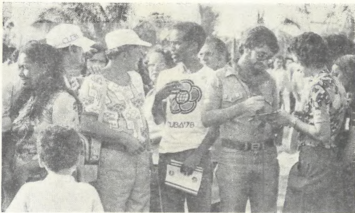
Символика встречи: Куба фестивальная — Москва Олимпийская.