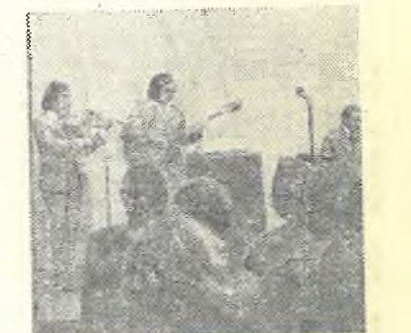
Выступление на Усть-Илимской ГЭС.

В поездке собран большой интересный материал и фотоматериал, сделаны записи встреч и концертов.