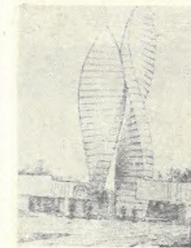
«Лукоморье» — пионерский лагерь в Братске.