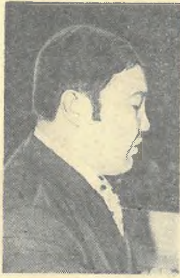
тендуют на звание лучшей.

На историческом факультете был организован смотр-конкурс на лучшую учебную группу. Борьба за высокое звание — важная форма соревнования студентов. Нужно продолжать это соревнование, развивать его. У нас сейчас много групп, которые имеют высокие показатели и пре-