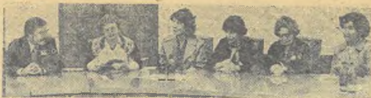
Встреча с коллегами из ГДР.

— Какое самое памятное событие в жизни вашего факультета произошло в юбилейном году? — с таким вопросом обратилась к физикам наш корреспондент Татьяна Ляпина.