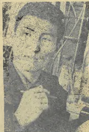
Учеба — поиск.

В университете действует система НСО, включающая 90 научных кружков и семинаров, в работе которых принимает деятельное участие более 3000 студентов. На кафедрах общественных наук исследовательскую работу ведут свыше 1000 человек.