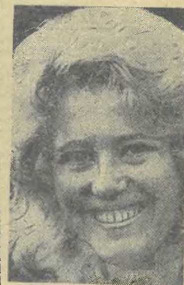
Выпускница юбилейного года.

Совет Министров Казахской ССР в декабре 1970 года утвердил проектное задание на строительство первой очереди комплекса зданий и сооружений имени Казахского ордена Трудового Красного Знамени государственного университета имени