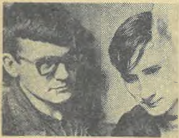
Науки юношей питают...

Широкое развитие в 1937/38 учебном году получила массово-физкультурная и оборонная работа. За год было подготовлено 30 воршиловских стрелков, 28 альпинистов, 37 парашютистов. Нормативы на значок ГТО сдали 190 человек. На значок ПВХО — 236 человек.