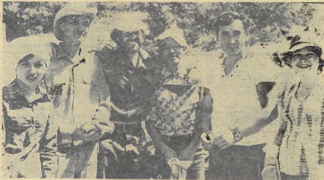
Парни, парни, это в наших силах Землю от пожара уберечь,