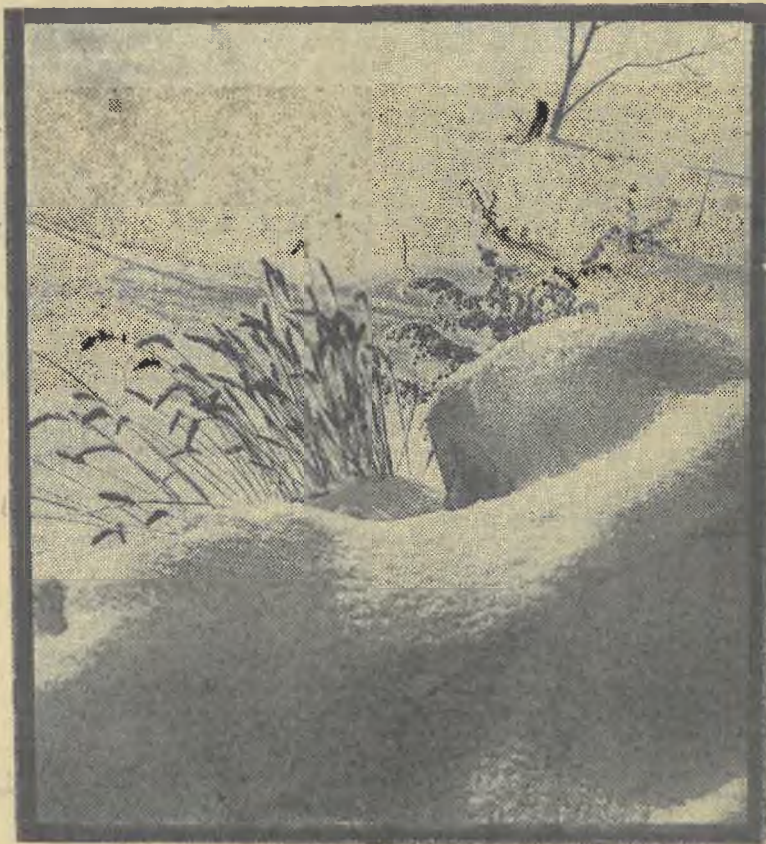
Идут белые снега...