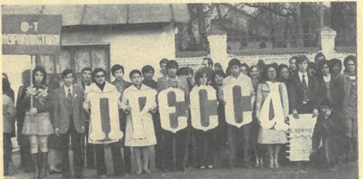
На снимке: первокурсники в праздничной колонне.