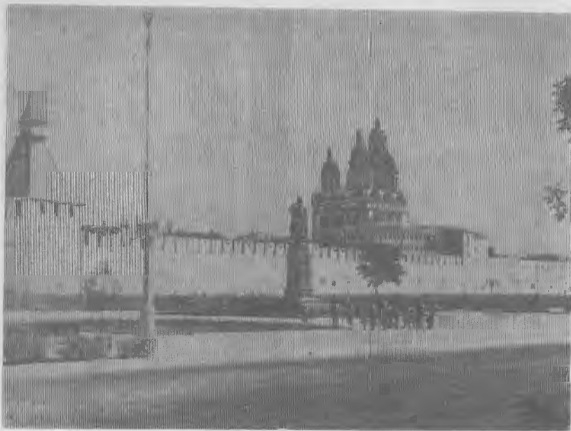
На снимке: студенты-географы у Астраханского Кремля.

Путешествие по родной стране дало нам, будущим географам, очень много. Ведь не случайно называют