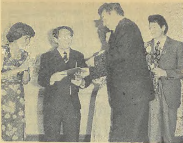
Дружба начинается с улыбки.

21 июня 1978 года. Среда. Большой актальный зал главного корпуса КазГУ переполнен. Все ждут встречи с самыми желанными и дорогими гостями — прославленными мастерами искусств из Большого театра Союза СССР, завершающего гастроль в Алматы.