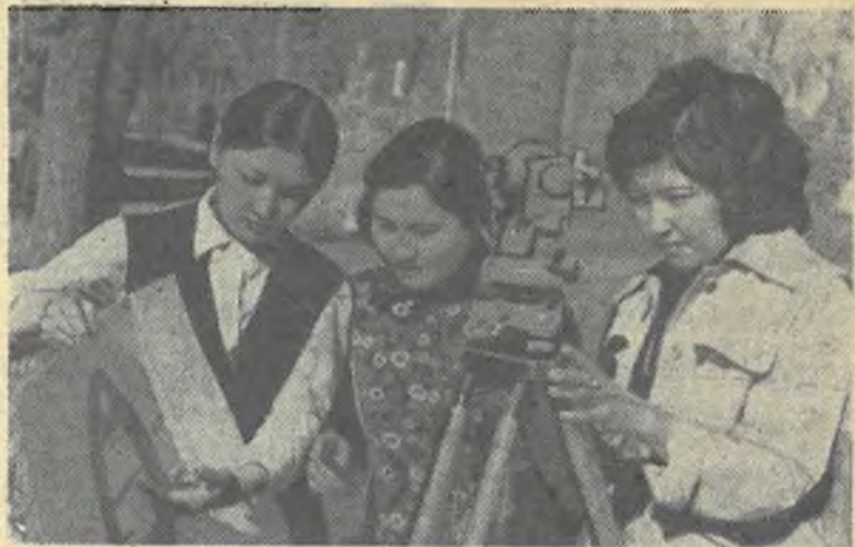
Студентки географического факультета на практических занятиях.