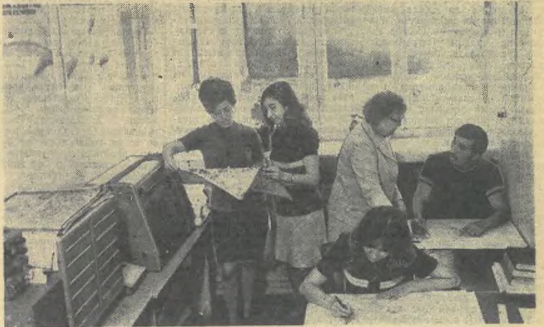
Студенты — гидрологи на занятиях.