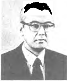
НАРИБАЕВ К.Н. - ректор университета

1. Руководство всей деятельностью университета и представление его в государственных органах, во всех учреждениях и организациях.