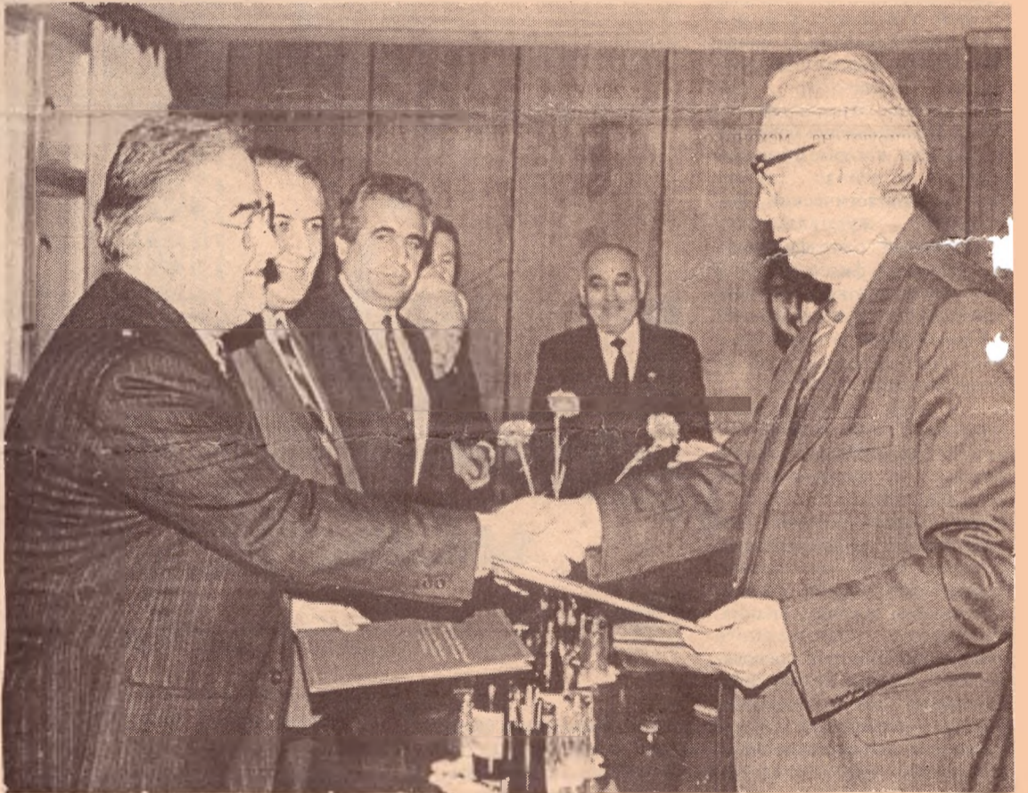
Подписан договор с ректором университета из Анкары (Турция)

В последние годы иностранные студенты на основных факультетах, стажеры и аспиранты обучаются в