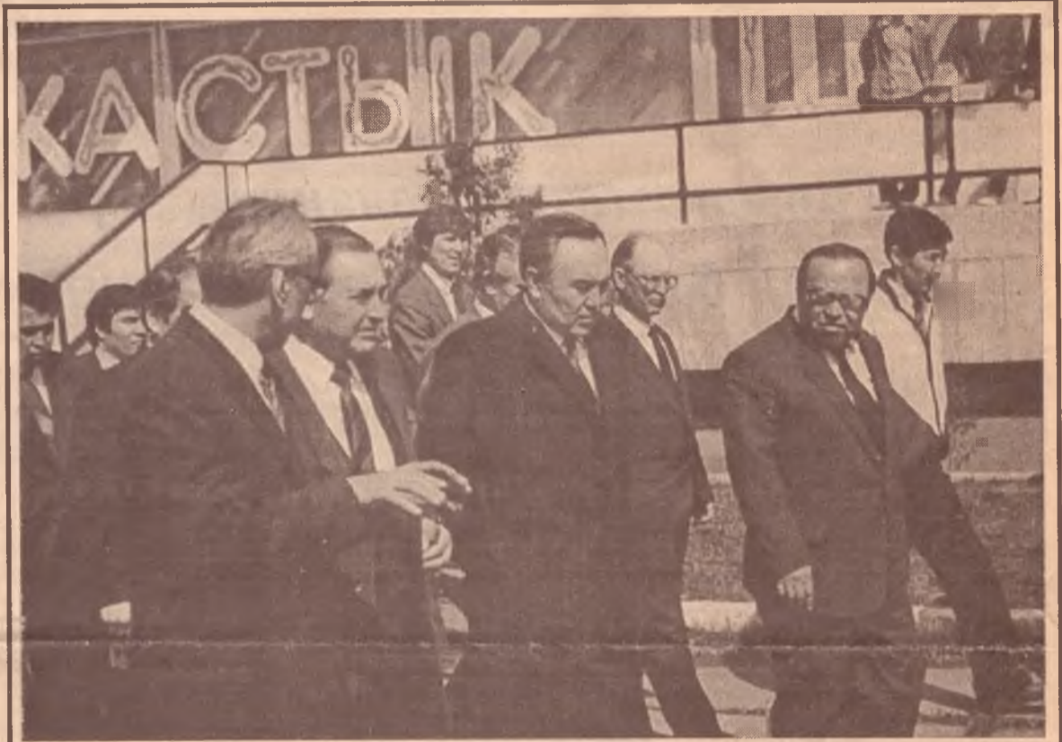
Во время посещения президентом РК Н.А. Назарбаевым университета

3. Научные основы изучения современного состояния и рационального использования природной среды внутриконтинентальных котловин.