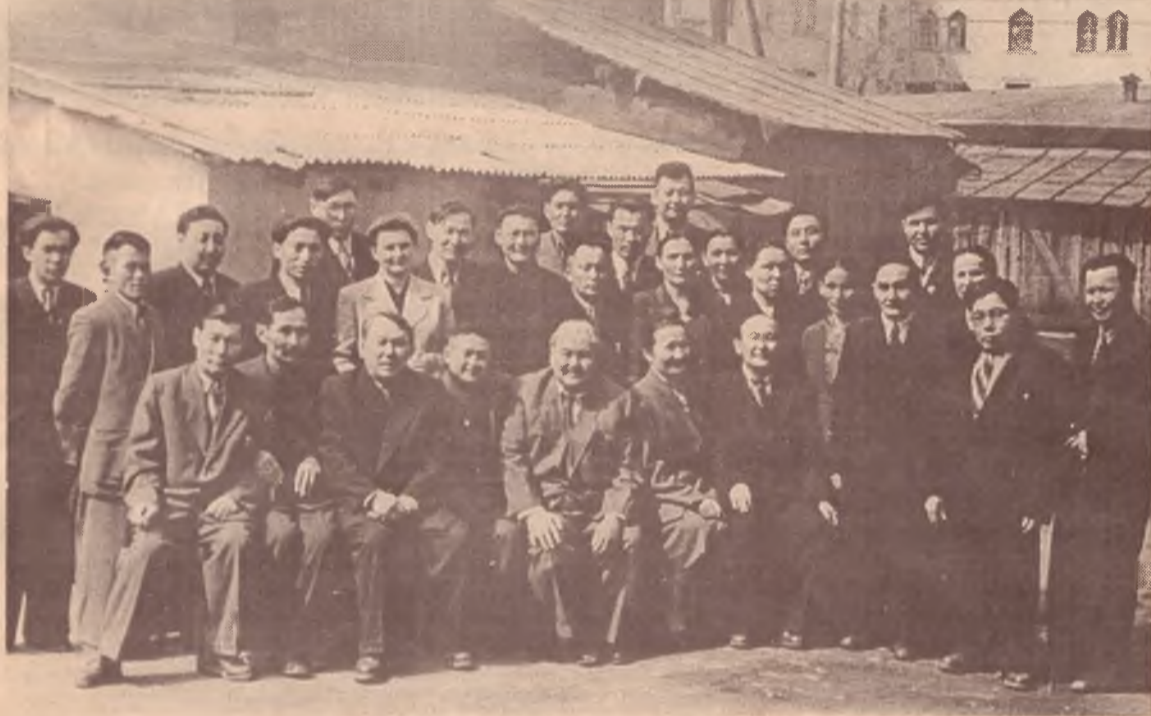
Қазақ тілі мен әдебиеті оқытушыларының республикалық кеңесіне (1957) қатысушылар.