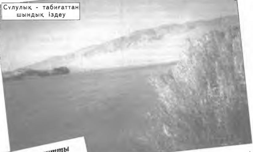
Сұлулық - табиғаттан шындық іздеу

Кейде талантты адамның өзгеден озық қасиеттерін, жетістіктерін өзіміз байқап жүрсек те, оны мойындап, өнеріне бас ию үшін алдымен өзге біреулердің бағалауын күтіп, “мәселені” олар көтергенше іштен тынып жүре тұратынымыз бар.