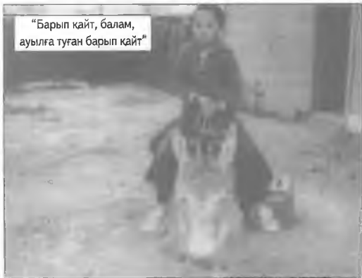
“Барып қайт, балам, ауылға туған барып қайт”