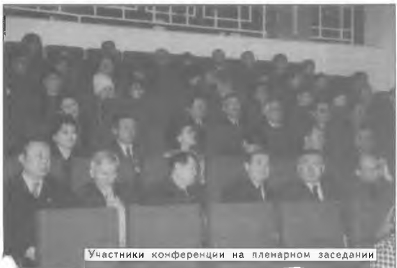
Участники конференции на пленарном заседании

32-я научно-методическая конференция стала заметным явлением в жизни университета и явилась определенным итогом творческой, педагогической и научно-методической работы всего коллектива.