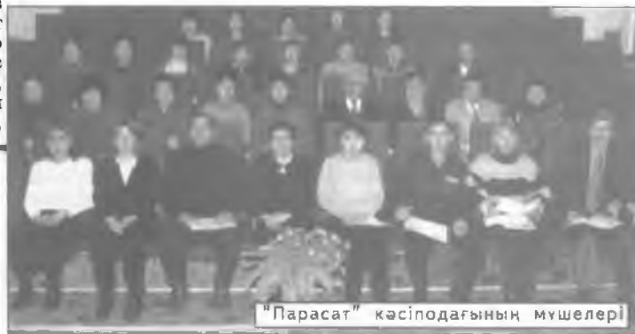
«Парасат» кәсіподағының мүшелері