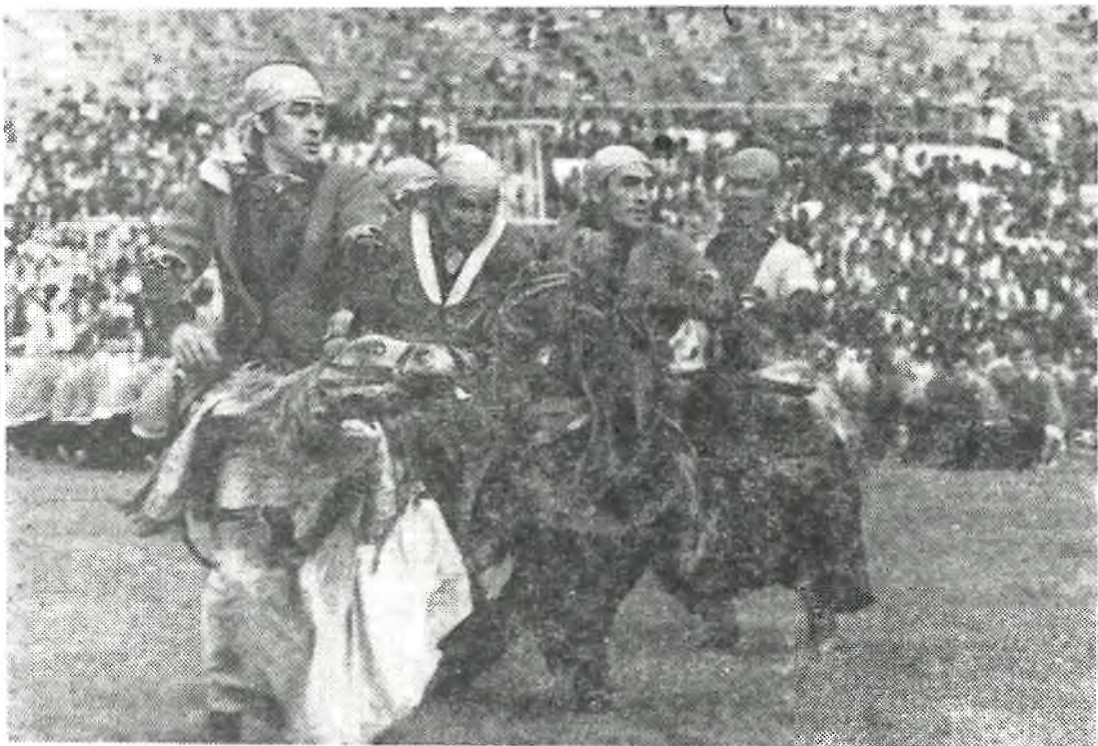
Удеткін жігіт, удеткін қане шабысты, Қайратын барда қолыннан берме, намысты!