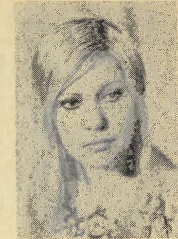
Студентка 3 курса филологического факультета. Стихи, предлагаемые вниманию читателей — первая публикация автора.