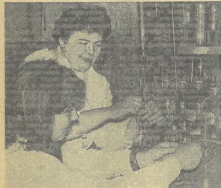
На снимке: студенты химического факультета имеют в своем распоряжении прекрасно оборудованные для проведения самых различных опытов лаборатории. Здесь многие из них ведут самостоятельные научные исследования.

Сейчас бывшие мои сокурсники трудятся на предприятиях, в учреждениях, в научно-исследовательских институтах. А вот в школах — только несколько человек.