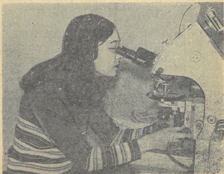
На снимке: в лаборатории био логического факультета.

(Материалы, посвященные абитуриенту-76 читайте на 2-3 стр.)