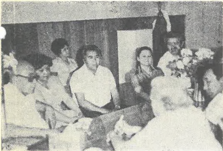
На снимке: во время посещения химического факультета ТашГУ.

организуют коллективные выезды в областные центры, где проводят специальные конференции по проблемам, связанным с определенной территорией, выступают с лекциями, докладами на промышленных предприятиях, в колхозах и учреждениях, встречаются с выпускниками университета, оказывают им большую практическую помощь, привлекают более талантливую часть молодежи для обучения в стенах университета. Ташкентский университет имеет научные связи с производством и отраслевыми институтами АН УЗ ССР и страны. Оказывают помощь молодому казахскому университету в повышении квалификации преподавательского состава, в подготовке научных кадров, участвуют в выполнении программ научных комплексных исследований по изучению ресурсов Аральского моря.