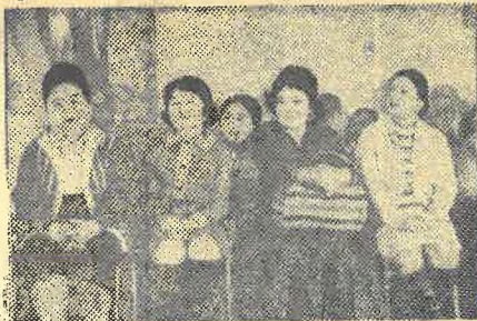
На снимке: гости «Муз»: народные артисты СССР С. Майканова, Р. Джаманова, Р. Багланова, А. Умуразакова.

О «Семи музах» писали газеты «Известия», «Советская культура», «Казахстанская правда», «Фройдштафт», местная печать, журналы «Огонек», «Русская речь» (орган АН СССР); о нас рассказывали корреспонденты таких крупнейших агентств, как ТАСС, АПН и