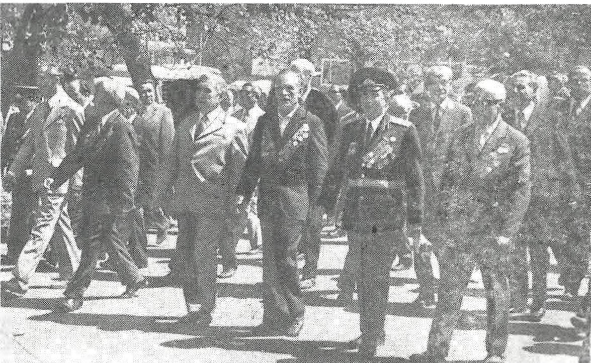
На снимке: колонна фронтовиков КазГУ на первомайской демонстрации.