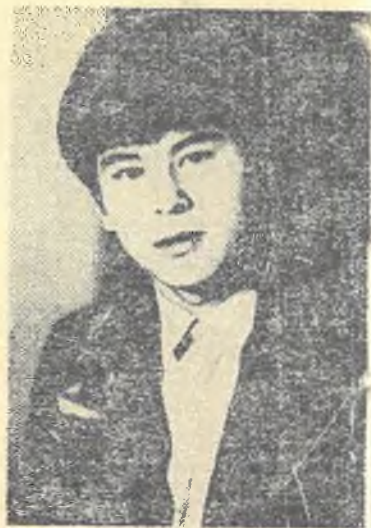
Байшұбар болар, Тайбурыл болар Әйтеуір, әйтеуір дайылдаламын. Қайда бет алам, өзін ұғарсын...

еткеніме) Арманым болмас елігіп барып Қосылсам текті тентектеріне. Төсіне шығып сайын даланың Еңшіге тиген тайымды аламын.