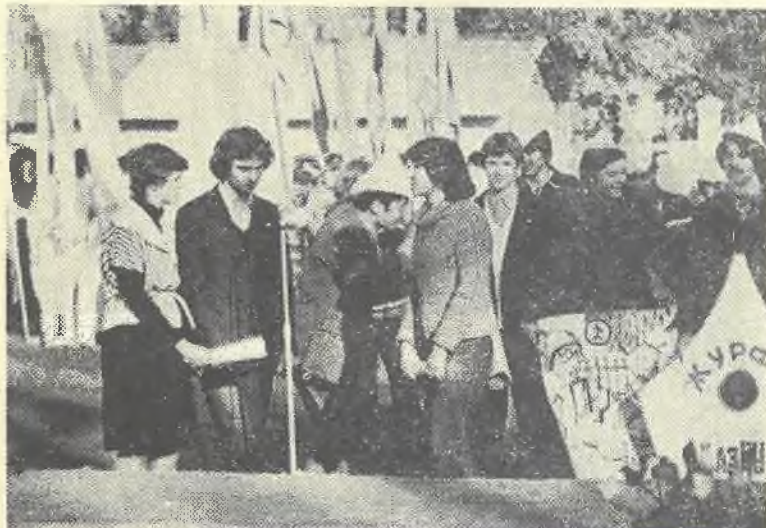
На снимке: Будущие журналисты на пороге...

В этом учебном году студенты V и VI курсов русского и спецотделений (40 человек) проходили практику в школах №№ 25, 36 и № 54 в г. Алма-Ате. Работая во всех классах приходилось гото-