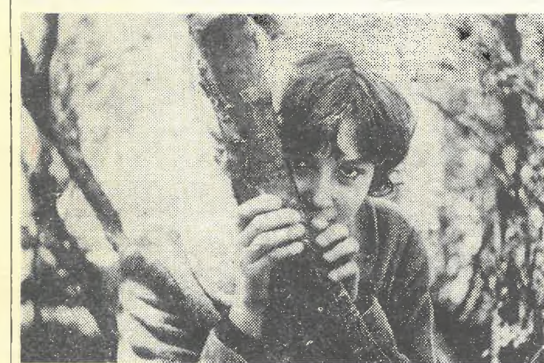
Весна — пора надежд и грусти нежной.