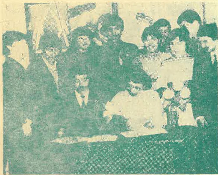
На снимке: подписание договора о сотрудничестве с монгольскими студентами.