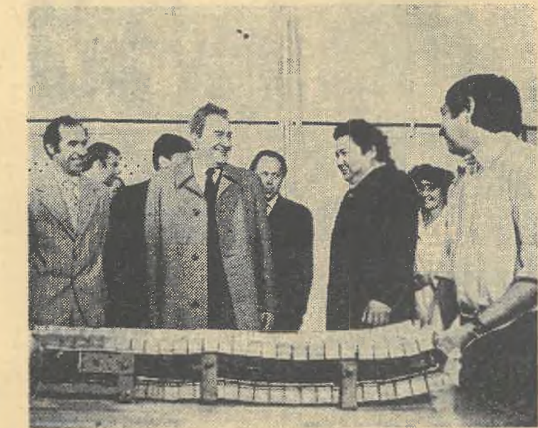
На снимке: Почетные гости на опытно-экспериментальном заводе.

При посещении университетского городка Д. А. Кунаев обратил внимание на важность поставленных партией больших задач по идейно-политическому воспитанию студенчества в полном соответствии с требованиями июньского (1983 г.) Пленума ЦК КПСС и