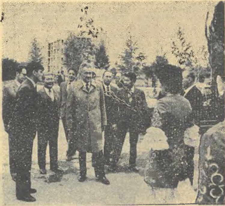
На снимке: Тов. Динмухамед Ахмедовича Кунаева и высоких гостей приветствуют студенты университета.

Знакомая с работой опытно-экспериментального завода, ректор университета, академик Академии