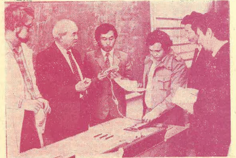
На снимке: Идет проверка аппаратуры в лингафонном кабинете филологического факультета.