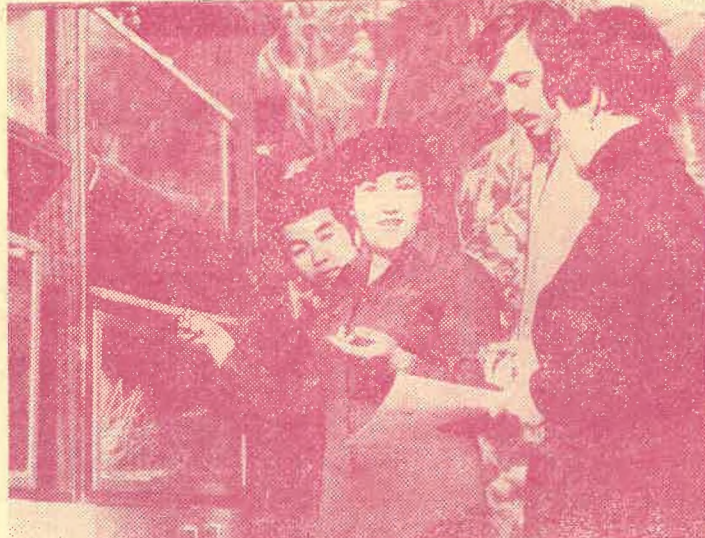
На снимке: Очередной рейд народных контролеров в лаборатории биологического факультета.

В последние годы постоянно на контроле группы находится воп-