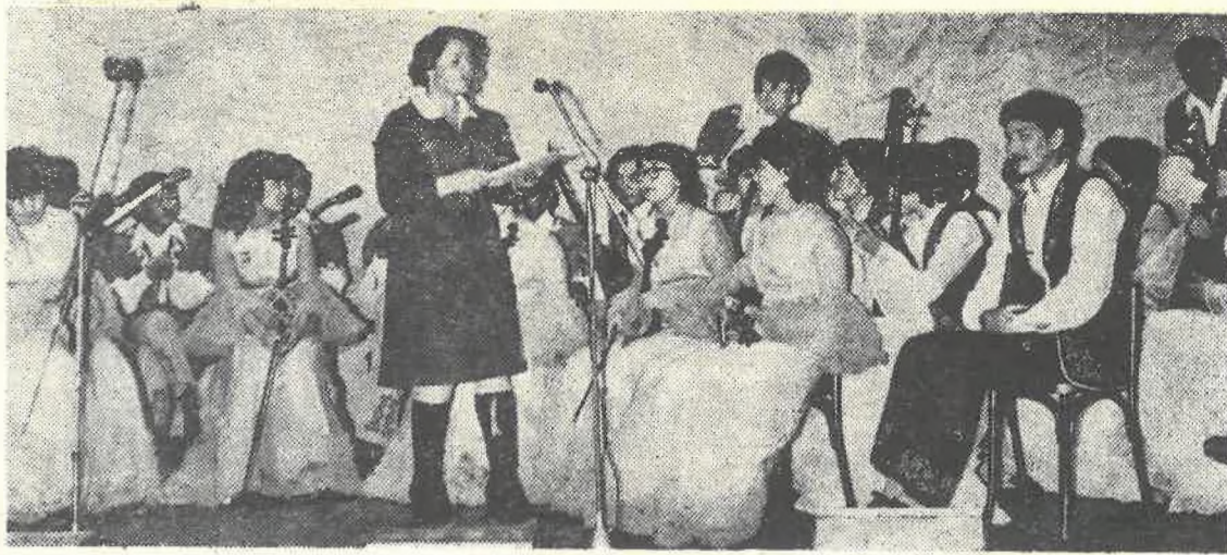
Еще мгновение и зазвучат кобызы, запоют домбры: выступление университетского оркестра казахских народных инструментов всегда праздник встречи с чарующими народными кюями и песнями.

В целом по университету смотр показал возросший уровень художественного мастерства участников. Увеличилась численность студентов, занимающихся в кружках художественной самодеятельности.