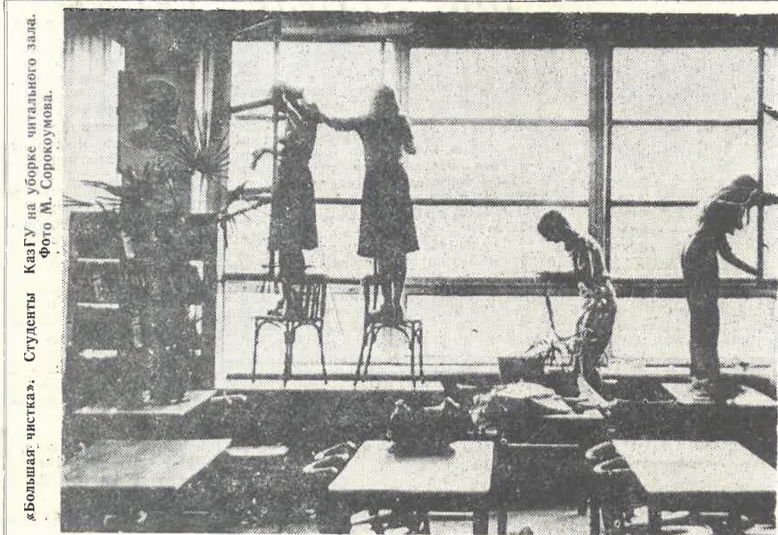
«Большая читка». Студенты КазГУ на уборке читального зала.

Изречения собрал студент журфака К. ДИК.