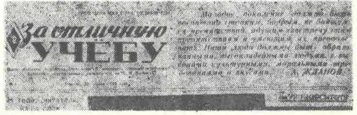
Так выглядел первый номер многотиражной газеты Казахского государственного университета имени С. М. Кирова, увидевший свет 20 апреля 1948 года.