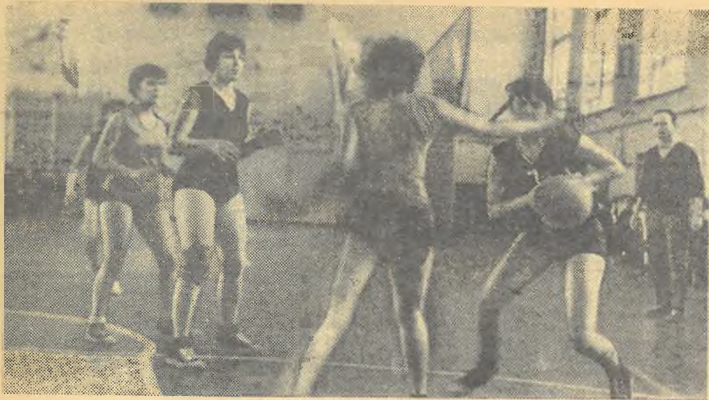
Момент баскетбольной игры команд Томского и Кыргызского университетов.