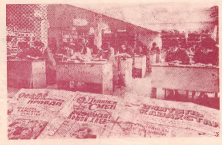
На снимке: студенты в читальном зале.