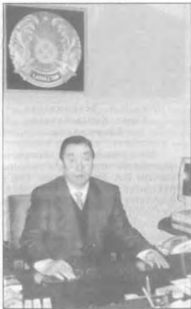
(Продолжение. Начало на 1 стр.)