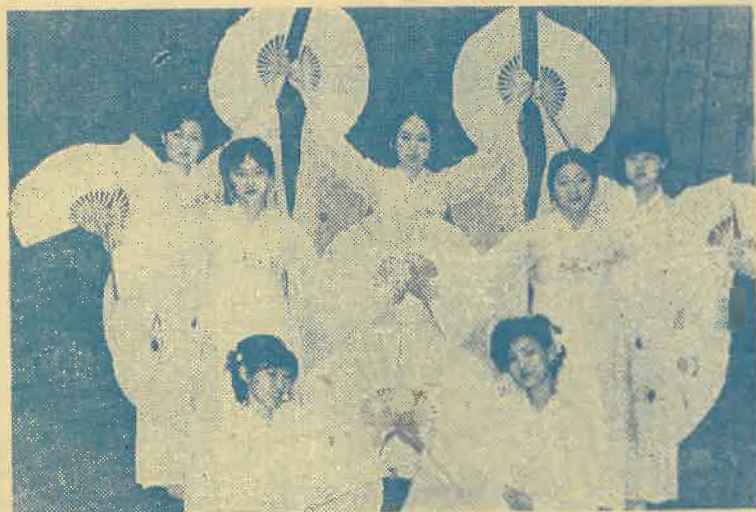
На снимке: Выступает лауреат фестиваля танцевальный коллектив Алма-Атинского государственного театрально-художественного института.