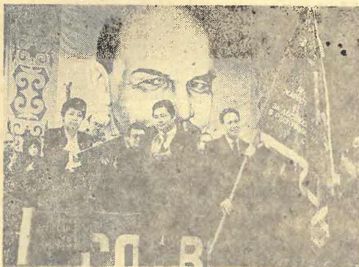
На снимке: Вручение КазГУ переходящего Красного знамени ЦК КП Казахстана, Совета Министров КазССР, Казсовпрофа и ЦК ЛКСМ Казахстана.

вания. Ежегодное совершенствование факультетского «Положения о социалистическом соревновании» нацелено на то, чтобы социалистические обязательства кафедр и факультета становились более напряженными.