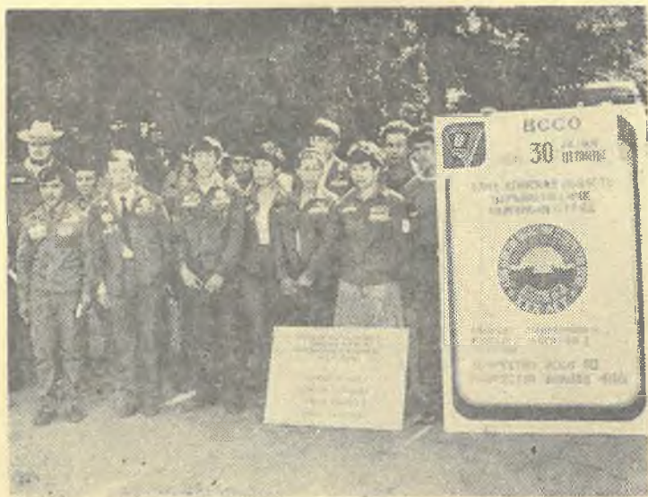
На снимке: Студенческий строительный отряд.

мола при поддержке парткома и ректората выработал определенную систему подготовки и организации деятельности студенческих отрядов, что позволило комсомольской организации университета достичь заметных успехов в