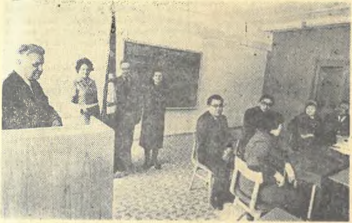
На снимке: Вручение филфаку переходящего Знамени по соцсоревнованию.

По результатам олимпиады «Студент и НТР» 1983 г. команда