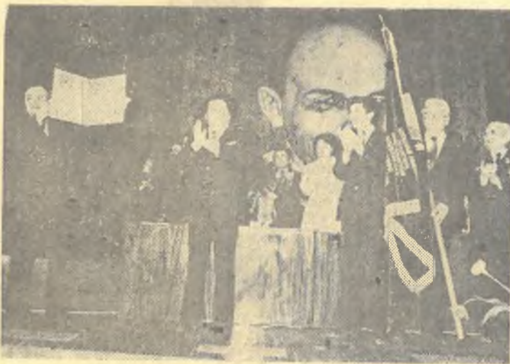
На снимке: Вручение КазГУ диплома за достижение наивысших результатов в республиканском соцсоревновании.

этих строк принимали участие на конференциях в Минске, Казани, Уфе и Алма-Ате, выступали с докладами об опыте работы. Статьи и доклады преподавателей публикуются в центральных журналах. Кафедрой подготовлен к выпуску сборник по актуальным