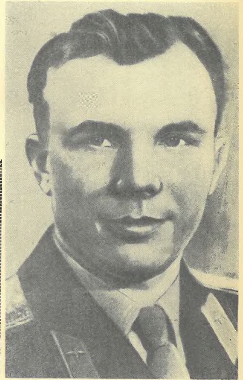
Герой Советского Союза Ю. А. ГАГАРИН.