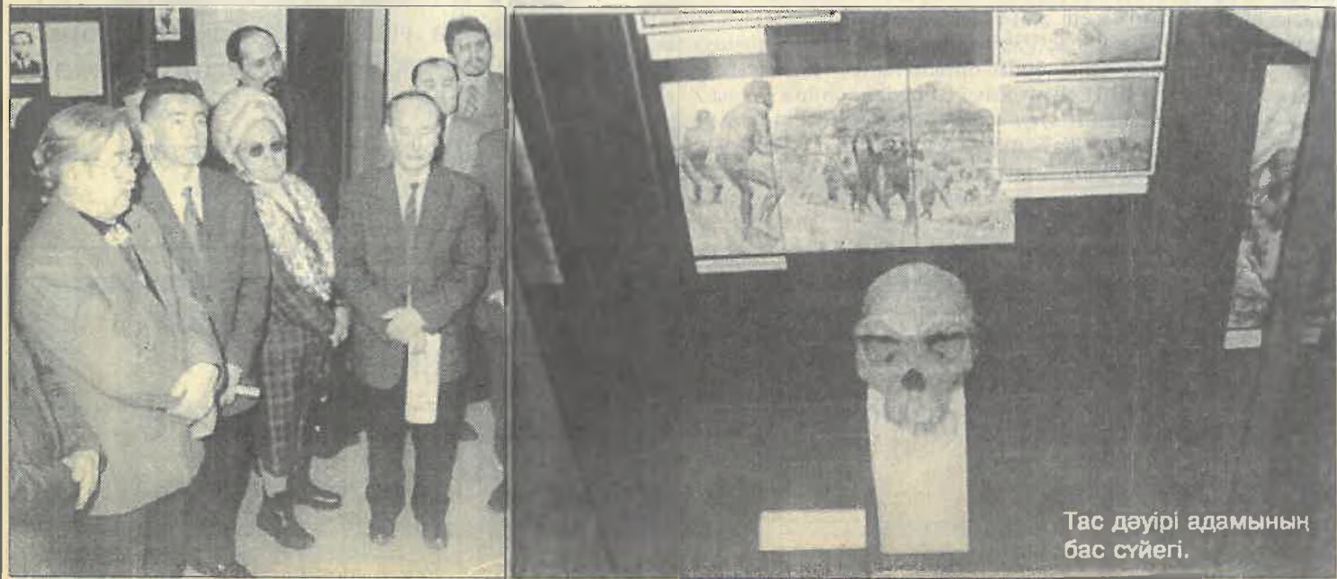
Тас дәуірі адамының бас сүйегі.