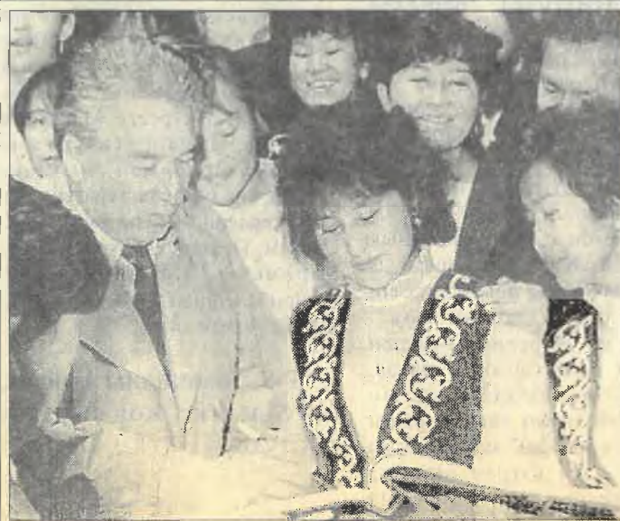
Ортамызда адамзаттың Айтматовы. 1997 жыл