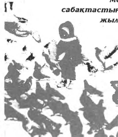
Бейбіт елдің болашағы

Ұрпақтар Үндестігі мен сабақтастығы жылы