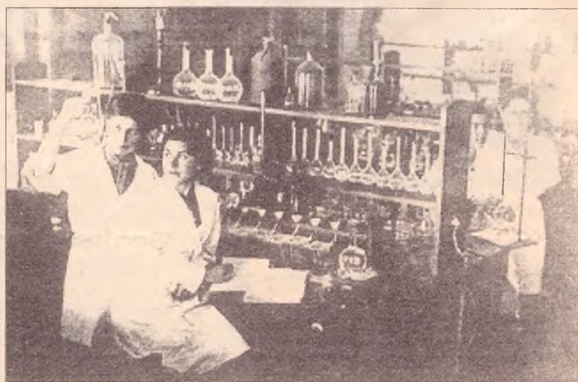
★ Производственная лаборатория КазГУ. Анализ минерального сырья. 1943 г.