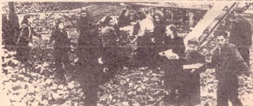
★ ҚазМУ-дың студенттері университет құрылысында (қазір мұнда ҚазМУ-дың физика факультеті орналасқан).