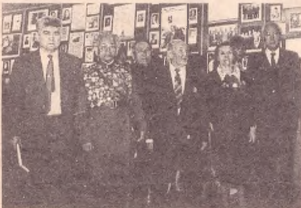
ҚазМУ-дың соғыс және еңбек ардагерлері Ұлы Жеңіске арналған көрме жанында.