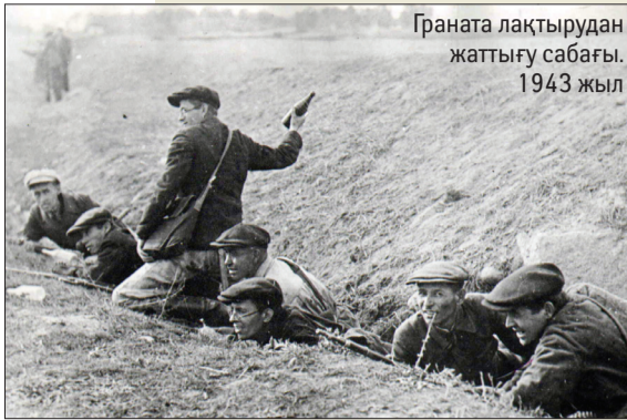
Граната лақтырудан жаттығу сабағы. 1943 жыл

Биыл Ұлы Отан соғысының Жеңісіне 65 жыл толып отыр. Соғыс елімізге, соның ішінде университет өміріне көптеген өзгерістер әкелді. Алматыға ЖОО-лардың эвакуациялануына байланысты, университет базасы кеңейіп, ғылыми-педагогикалық кадрлар толықты. ҚазҰУ-дың профессорлық-оқытушылар құрамы мен студенттері қан майданға аттанып, Отан қорғады. Ал, тылда қалғандары майданға түрлі деңгейдегі көмектер көрсетуден аянбады. Осыған орай, газетімізде соғыс жылдарындағы университет тарихынан сыр шертетін хронологиялық ақпарат беріп отырмыз.