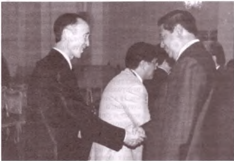
Индонезия Президенті доктор Сусило Бамбанг Юдхоуоно Қазақстан командасының жетекшісін құттықтайды

Бір анығы, университетімізге нағыз талантты жастарды көптеп бағдарлаудың маңызы аса зор. Елімізде бүгінгі күні қалыптасқан Бірыңғай ұлттық тестілеу талаптарына сәйкес, ертеңгі талапкерлер өзінің болашақ мамандығын мектеп қабырғасында жүріп-ақ таңдайды. Сондықтан бұл маңызды іс-шараларды болашақ студенттеріміз мектептің соңғы сыныптарында оқып жүрген кезде-ақ қарқынды түрде жүргізуге тиіспіз. Осымен байланысты алыс-жақын шет елдердің белді университеттеріндегі, әсіресе Москва физика-техникалық институтындағы істердің мол тәжірибесі жіті назарға алғанға лайық. Кезінде Нобельдік сыйлықтық екі бірдей лауреаттары Петр Капица мен Николай Семеновтың тікелей басшылығымен ұйымдастырылып, қалыптасқан бұл университеттің жас таланттарды елдің түкпір-түкпірінен табудағы, оларды оқуға түсуге даярлаудағы, одан әрі университет қабырғасында сапалы оқытудағы мол тәжірибесін үйренуге, біздің жағдайымызға ыңғайлап қолдануға әбден болады. Бүгінгі күні осы университеттің қабырғасынан білім алып шыққан түлектер АҚШ пен Европаның көптеген белді ғылыми орталықтарында табыспен жұмыс істеп жатыр. Бұл университеттің дип-