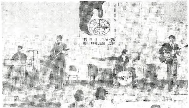
На снимке: ансамбль «Тайфун».

4 января совет эстетического воспитания организовал и провел встречу с режиссером-постановщиком таких кинофильмов как «Романс о влюбленных», «Дворянское гнездо», «Дядя Ваня», «Песня о Маншук», А. С. Михалковым-Кончаловским. Встреча прошла очень интересно. Режиссер рассказал о своих фильмах, о планах на будущее. По его фильму «Романс о влюбленных», недавно вышедшему на экран, состоялась дискуссия.