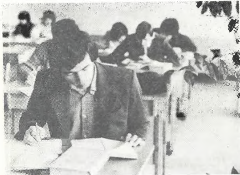
На снимке: Подготовка к сессии.

Зимняя экзаменационная сессия скоро вступает в силу. Дорогие друзья, студенты, успешно сдадим экзаменационную сессию второго года одиннадцатой пятилетки и порадуем Родину, родную Коммунистическую партию хорошим и отличным знанием на экзаменах!