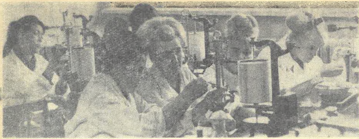
Идут практические занятия по физиологии животных у студентов третьего курса биологического факультета. Именно здесь приходит первый опыт, который впоследствии поможет безошибочно и точно поставить эксперимент.