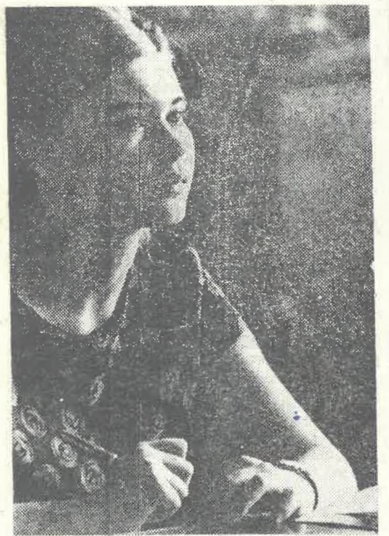
Публикацией этих снимков, сделанных нашим фотокорреспондентом на вступительных экзаменах, мы открываем сегодня маленький конкурс на лучшую подпись к каждой фотографии. Фамилии отличившихся будут опубликованы в нашей газете.