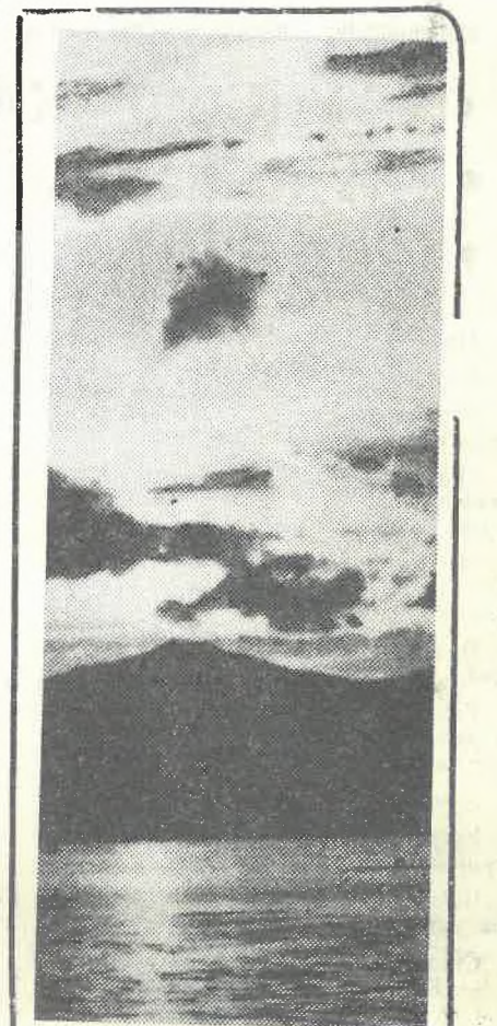
ЗАХОД СОЛНЦА.

А. ЦАРЕВ, комиссар студенческого отряда.